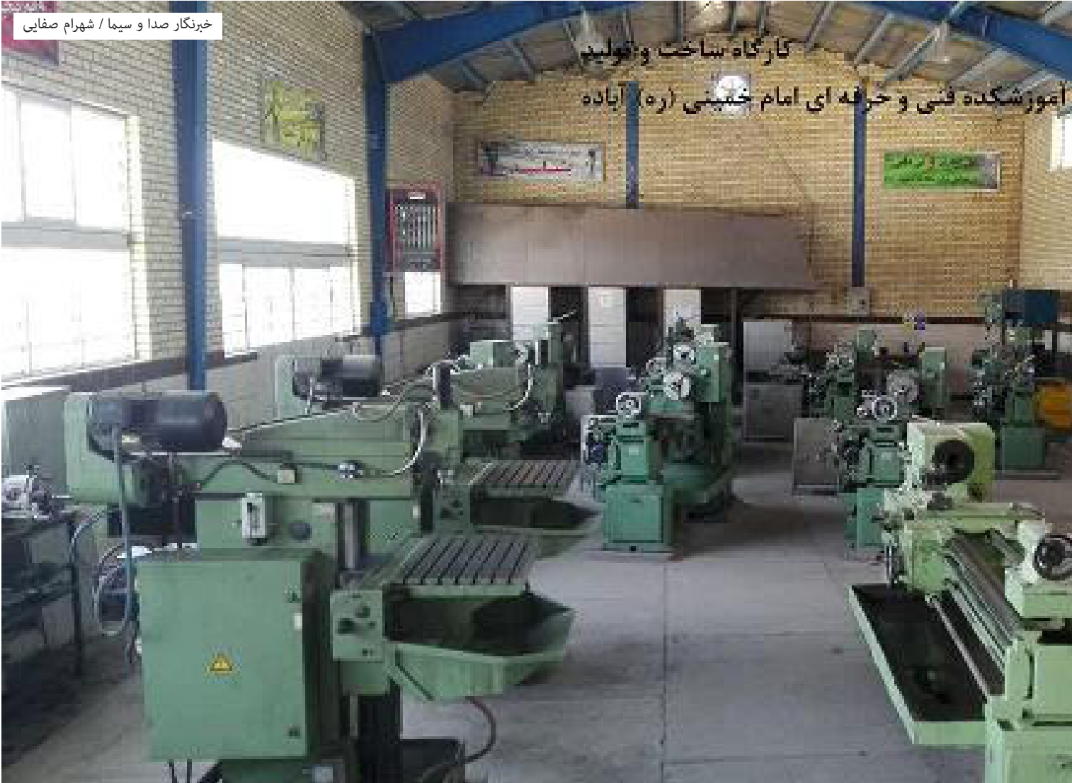
خبرنگار صدا و سیما / شهرام صفایی