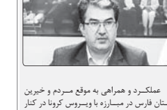
مدیرکل دفتر امور زنان و خانواده استانداری فارس خبر داد

افزود: پیش بینی شده یک طبقه از بیمارستان ها و مراکز درمانی خصوصی فارس نیز مجهز شوند تا در صورت نیاز از آنها استفاده شود.