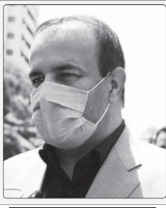
مدیرکل دفتر امور زنان و خانواده استانداری فارس خبر داد

جریان گاز در بعضی از مناطق شهر شیراز سه شنبه (۲۲) قطع می شود.