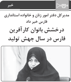
مدیرکل دفتر امور زنان و خانواده استانداری فارس خبر داد